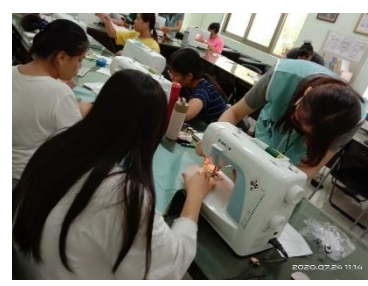
7/24暑期課程 初次體驗縫紉課程， 製作簡易衛生紙套。