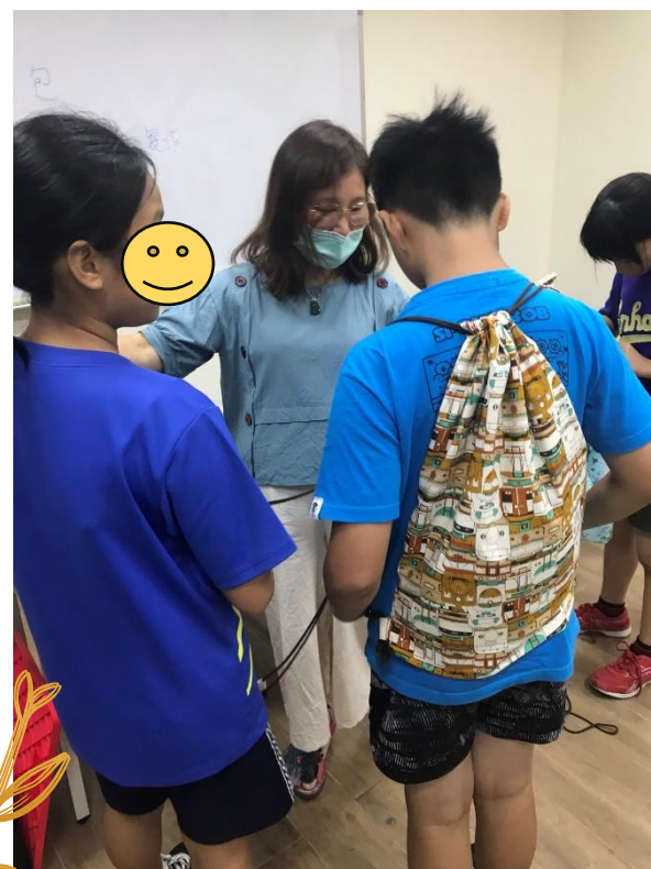
台中慈馨 兒少之家