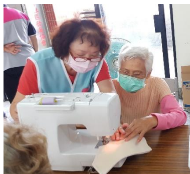
志工們耐心的教導長輩如何車縫，讓長輩們體驗縫紉的樂趣。