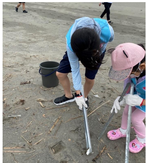
▲由爸媽親自帶著小朋友一起淨灘，建立正確的環保觀念。