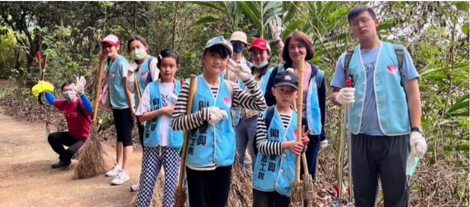
▲第三組有好多新的淨山好夥伴，歡迎明年繼續參加喔，我們很需要新的戰力加入~~