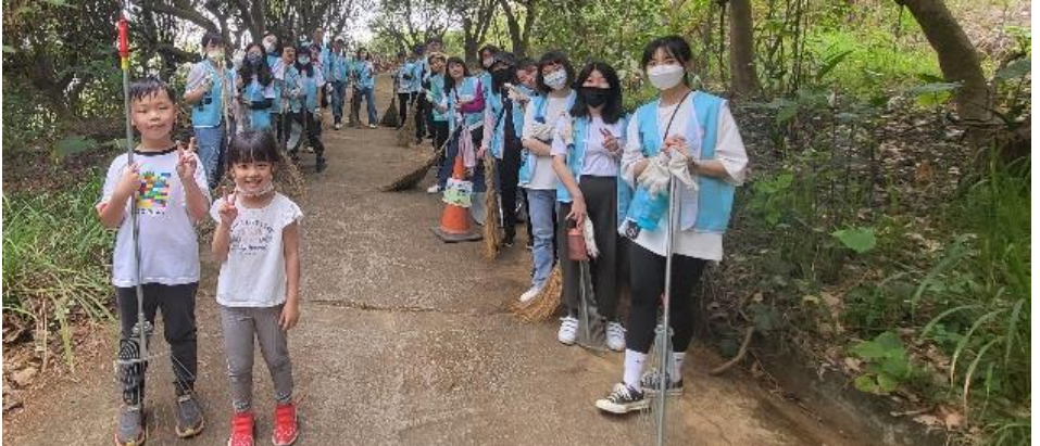
▲第六組是安永會計事務所的夥伴們，希望淨山初體驗不會把你們嚇跑，明年還要來喔 XD