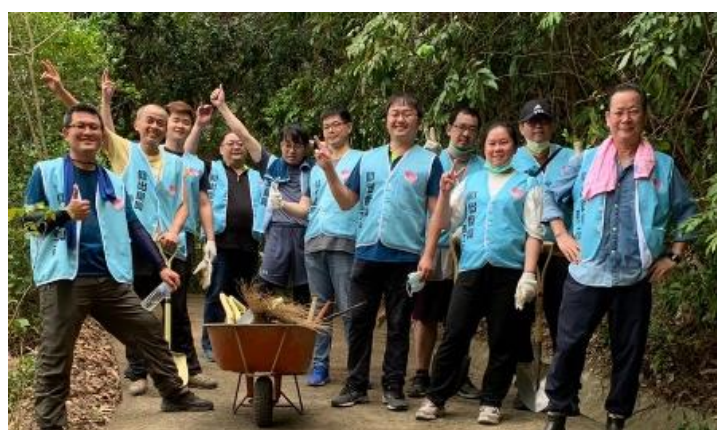
▲壯丁組鏟土、運土、砍枝葉、搬運枯樹，不到半小時就汗流浹背，真是辛苦你們了！