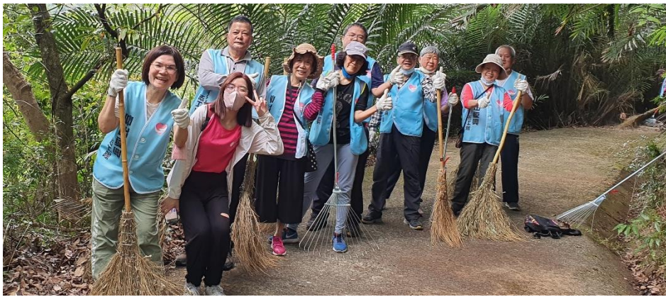
▲第一組的資深志工夥伴，年紀雖然高但戰力也很高~辛苦了~感謝連續兩年的支持~愛你們