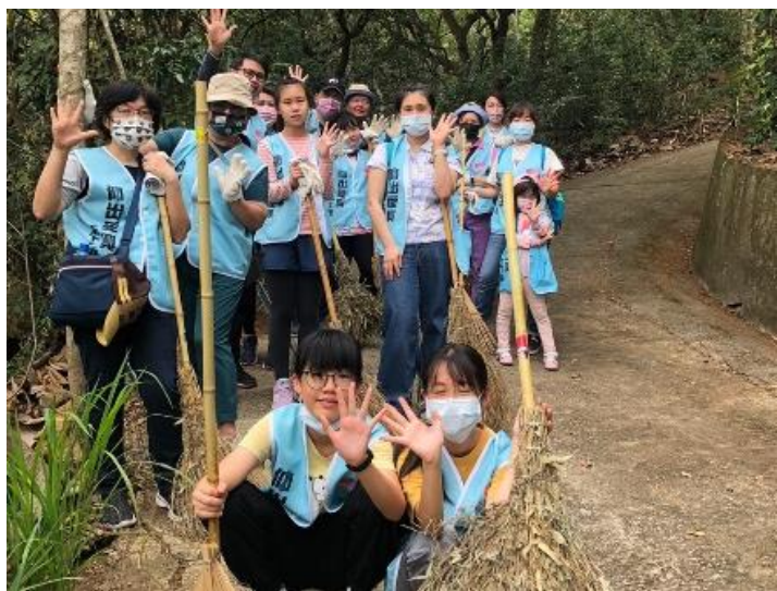
▲第五組有很多爸爸媽媽帶著孩子一起來當志工。看著小朋友拿著比自己還要高的掃把掃落葉，就覺得好感動！