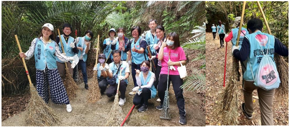
▲第二組好多忠實淨山夥伴，連續四年年都揹著第一屆淨山的背包來淨山，好感動阿~