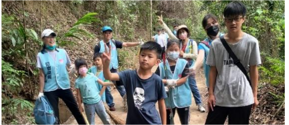
▲第四組的小朋友們要爬上好漢坡才能抵達清掃區域，真是辛苦你們了~