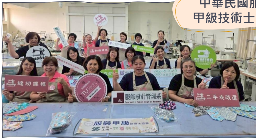
中華民國服裝 甲級技術士協會

♥ 今年的千份布衛生棉計畫，不只是伸興志工隊的行動，更串聯了10個公益夥伴共同響應，希望透過大家的力量，傳送更多溫暖！感謝臺中市志願服務推廣中心、社團法人中華民國服裝甲級技術士協會、台南應用科技大學、財團法人基督教芥菜種會、木匠的家關懷協會、苗栗縣婦女福利服務中心、中原客家文化發展協會、立家手創館、台灣喜佳、新竹青空心理治療所及台南匯續永續股份有限公司等夥伴，在收到邀請後都毫不猶豫地加入行列，一起投入這項充滿意義的公益行動；同時也感謝指導單位臺中市政府社會局，全力提供各項支持與協助。兩天活動完成的280片布衛生棉只是起點，其餘數量將由各合作單位於不同月份陸續舉辦工作坊接力製作，讓這份愛心持續傳遞一整年！上半年已完成