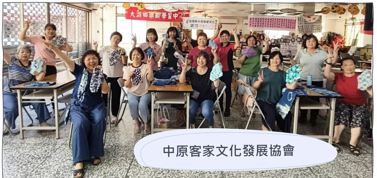
中原客家文化發展協會