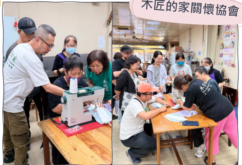
木匠的家關懷協會