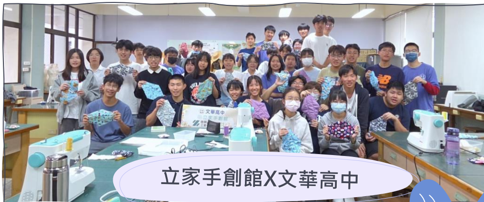
立家手創館X文華高中