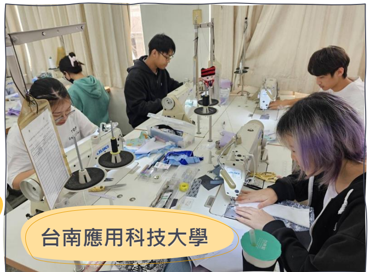
台南應用科技大學